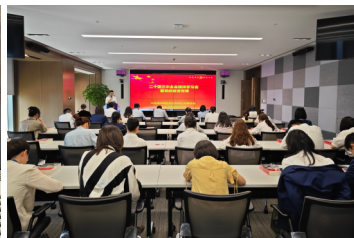
学习贯彻二十届三中全会精神学习会 暨党纪教育党课活动