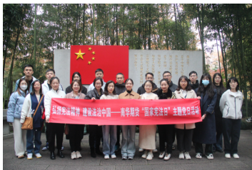
南华期货党委开展主题党日活动

此外, 公司把工会职工代表小组活动与党支部定期的理论学习有机结合, 组织职工代表走进党组织, 参加党委、党支部开展的各项活动, 学党课、观党史, 倡议员工在“学习强国”平台上学习各类专业知识, 不断提高政治站位, 以党建引领, 开拓创新思路。2024年7月6日, 南华期货党委联合工会组织党员和工会代表前往浙江嘉兴南湖革命纪念馆, 瞻仰党的诞生地, 回顾建党历史, 重温入党誓词, 增强理想信念, 赓续红色血脉。2024年10月29日, 南华期货党委、工会、团委组织党员、职工共同观看抗美援朝爱国题材影片《志愿军存亡之战》, 回顾波澜壮阔的历史。