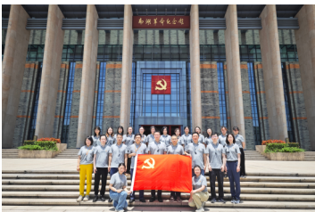
南华期货开展纪念中国共产党 成立103周年主题党日活动