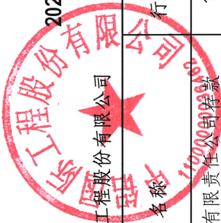
2024年度通过中铝财务有限责任公司存款、贷款等金融业务汇总表