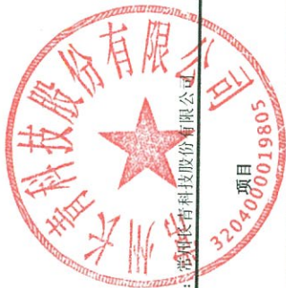
母公司所有者权益变动表 2024年度