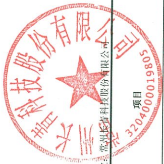
母公司所有者权益变动表 2024年度