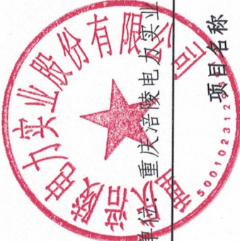
2024年度涉及中国电力财务有限公司存款、贷款等金融业务汇总表