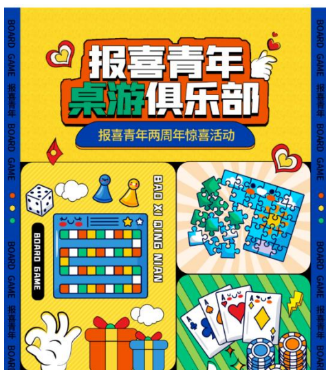
报喜青年桌游俱乐部

公司携手温州市第七人民医院，精心策划并成功举办了心理健康义诊支援服务活动，提高员工健康意识，保障员工健康水平。