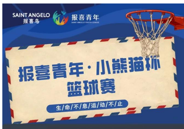
青春同行·报喜有你|小熊猫杯篮球赛