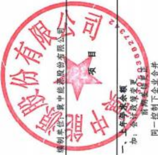
合并股东权益变动表 2024年度