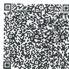
范娱瑾的年检二维码

本证书经检验合格, 继续有效一年。 This certificate is valid for another year after this renewal.