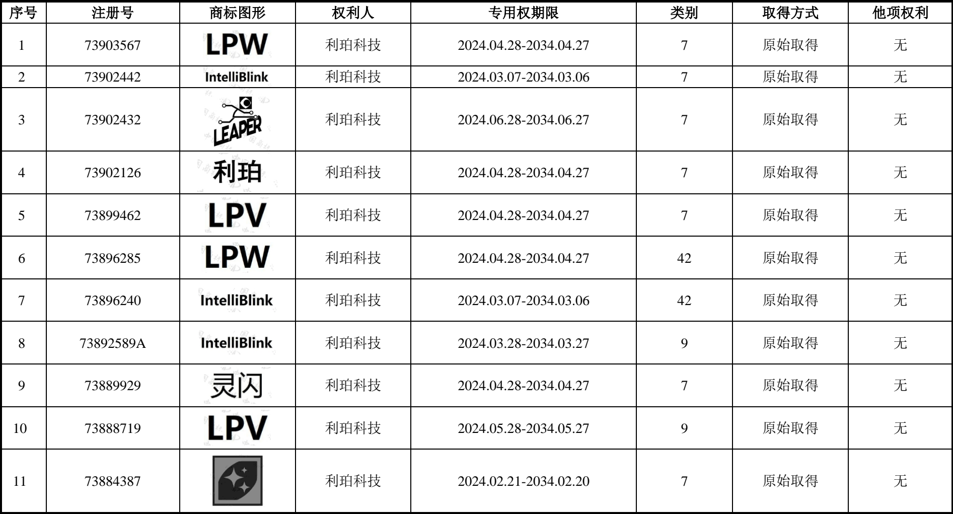
附件二：注册商标清单