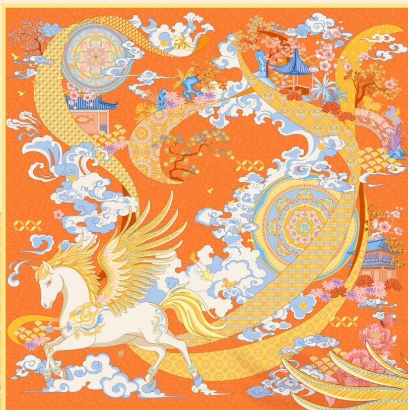
天马颂福·真丝丝巾