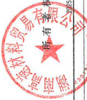
所有者权益变动表