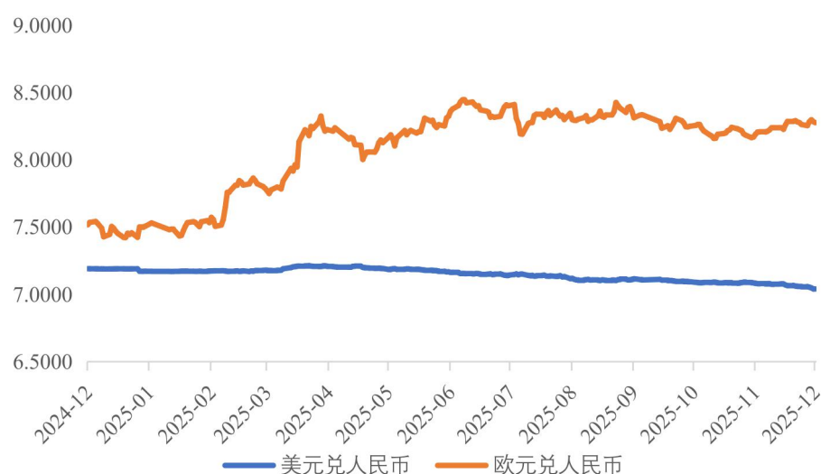
最近一年美元、欧元兑人民币走势

报告期内，公司境外销售收入分别为 125,289.95 万元、238,174.42 万元、295,448.93 万元和 379,052.01 万元，占营业收入的比例分别为 29.98%、44.09%、42.93%和 60.59%。报告期内，公司汇兑损益分别为 1,494.13 万元、332.92 万元、495.36 万元和 1,619.74 万元。公司及子公司在业务开展过程中，部分业务的采购和销售通过卢比、欧元、美元等币种进行结算。最近一年，上述币种兑人民币汇率走势如下：