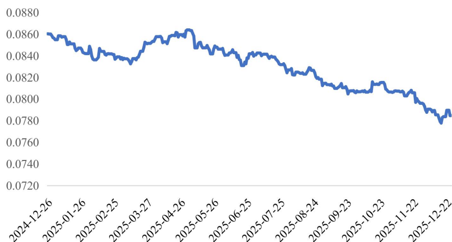
最近一年卢比兑人民币走势

最近一年，以人民币中间价计，美元兑人民币汇率整体波动率为 2.52%；欧元兑人民币汇率整体波动率为 13.82%；卢比兑人民币汇率整体波动率为 11.07%，最近一年来，人民币汇率整体逐步走强。2025 年 1-9 月，公司实现汇兑损益 1,619.74 万元。