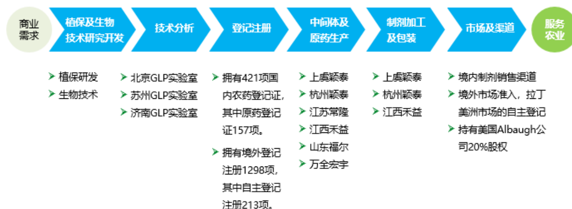
颖泰生物全产业链商业模式图