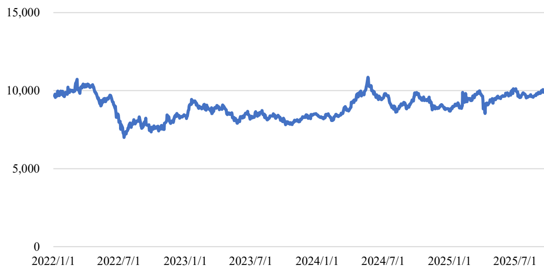
LME现货铜价走势 (2022年1月1日-2025年9月30日, 单位: 美元/吨)