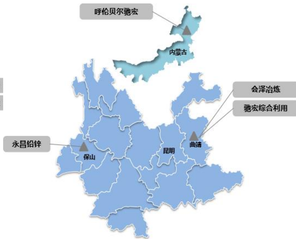
铅锌冶炼企业布局图