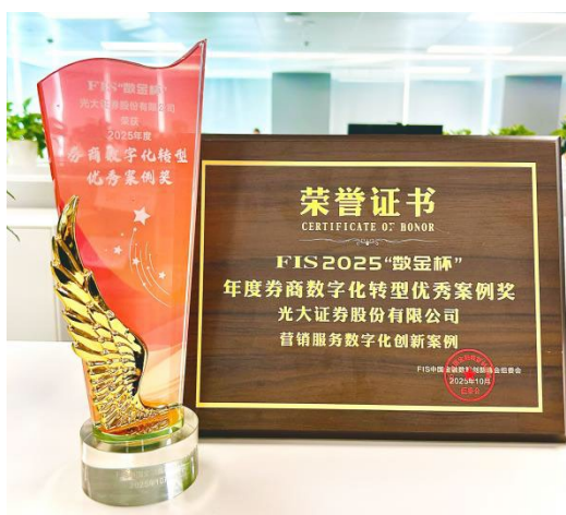
图：FIS2025 中国金融数智创新峰会 2025 年度券商数字化转型优秀案例奖奖杯及证书