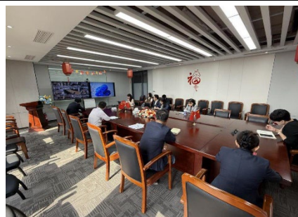
图：北京月坛营业部 开展合规分享交流活动