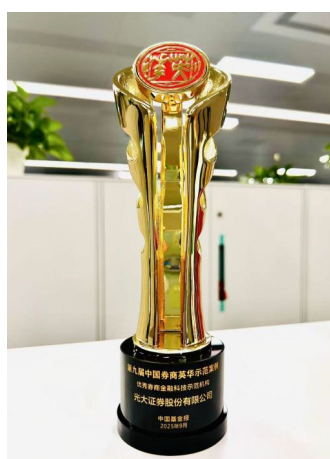
图：中国基金报社优秀券商金融科技示范机构奖杯