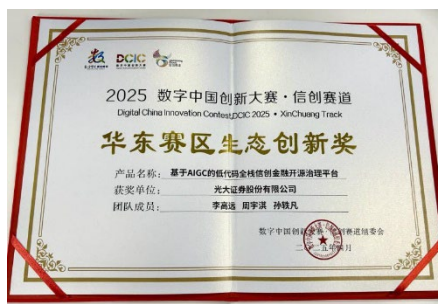
图：数字中国建设峰会组委会华东赛区“生态创新奖”证书