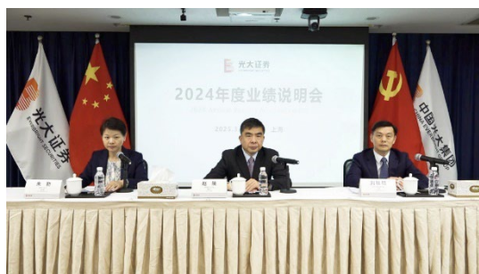
图注：光大证券 2024 年度业绩说明会

2025 年 3 月，光大证券在上证路演中心、路演中等平台，通过直播的方式召开 2024 年度业绩说明会，与投资者围绕公司 2024 年业绩情况和公司未来战略发展布局等问题开展深入沟通交流，在互动交流环节，公司还围绕业绩展望、分红安排等重点问题进行了回答。