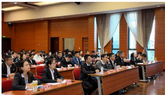
图：深入学习贯彻党的二十届四中全会精神暨加强基层党建工作干部进修班

公司积极推动青年理论学习小组与党支部深度融合，组织青年重点学习二十届四中全会精神，通过创新教育形式，打造“传承五四薪火·绽放奋斗青春”主题活动，设计“红色 City Walk”沉浸式学习路线，组织近 30 名集团驻沪企业青年参加。