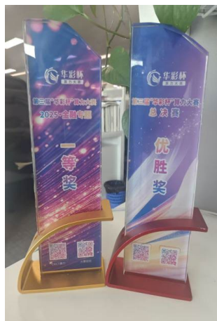
图：中国信通院第三届“华彩杯”算力创新应用大赛金融专题赛奖杯