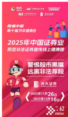
图：2025“跑遍中国证券业防范非法证券宣传健康跑—光大证券站”活动海报

2025年，光大证券组织承办2025“跑遍中国证券业防范非法证券宣传健康跑—光大证券站”活动。本次活动以“警惕股市黑嘴，远离非法荐股”为核心主题，将中国特色金融文化、证券行业文化建设与健康生活方式有机融合，以群众喜闻乐见的运动为载体，将防范非法金融知识融入赛事全程，为塑造健康的行业文化、优化行业发展生态贡献力量。