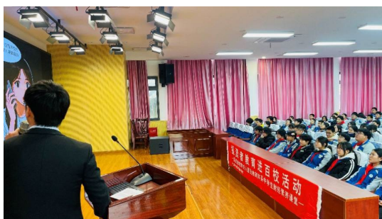
图：“投资者教育进百校”现场图片

2025年3月，光大证券携手中国光大银行在崇明大新中学开展防非反诈教育宣传活动，以AI绘本讲故事的形式，为同学们开展反诈知识讲座，通过生动有趣的案例，讲解了“医药费转账骗局”、“补习班学费骗局”、“追星骗局”、“直播间骗局”等故事，通过一个个真实案例，提升同学们的生活安全意识，筑牢反诈防线。