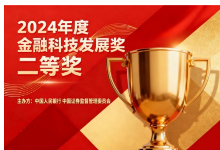
图：《证券业智能数据生态体系构建-阳光e数》获人民银行金融科技发展奖二等奖

随着公司业务的持续拓展和数字化转型的深入推进，“阳光e数”将进一步推广应用，不断优化功能，拓展服务边界，与更多业务场景深度融合，为公司的创新发展提供更有力的数据支持。同时，也为行业内其他企业的数据应用项目提供了可借鉴的优秀范例，助力推动证券行业数据应用水平的整体提升。