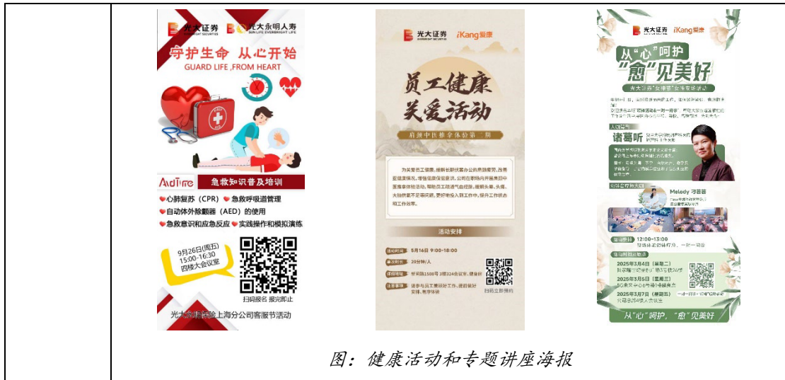
图：健康活动和专题讲座海报