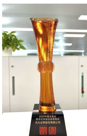
图：2025 中国证券业数字化实践全能君鼎奖奖杯