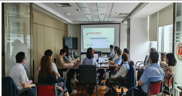
图：佛山季华六路营业部 开展合规分享交流活动

北京月坛营业部活动中，合规负责人带领大家一起学习合规案例，邀请同事分享心得，表示在提供服务时，应全面了解投资者情况，严格遵守适当性匹配规则，将适当的产品销售给适合的投资者，以达到保护投资者和防范金融风险的目的。