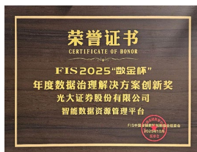
图：FIS2025 年度数据治理解决方案创新奖证书