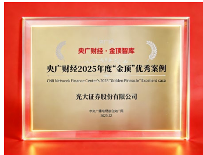
图：央广财经 2025 年度“金顶”优秀案例证书