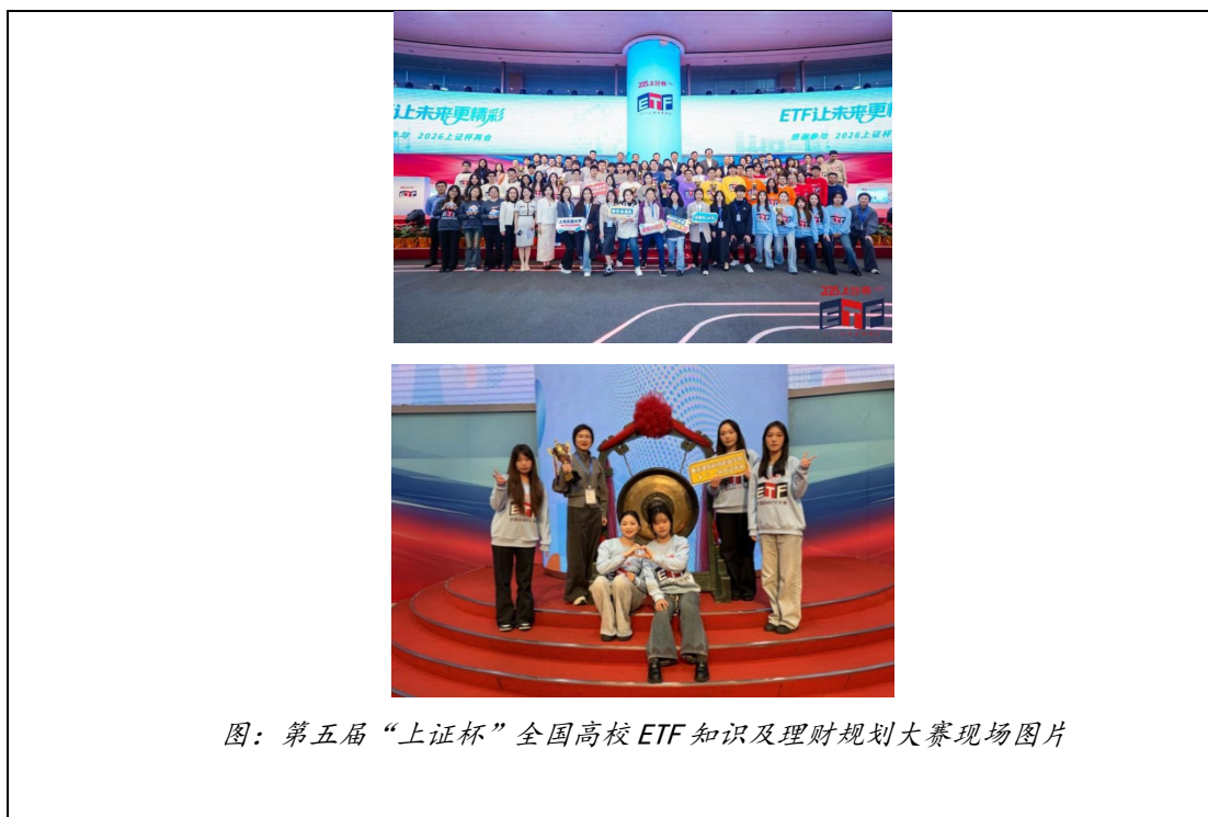
图：第五届“上证杯”全国高校ETF知识及理财规划大赛现场图片