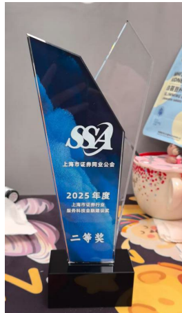
图：上海市金融工会工作委员会、证券同业公会服务科技金融建设二等奖奖杯

《AI“智”服务—双引擎智能客户服务方案》获得上海市金融工会工作委员会、证券同业公会服务科技金融建设二等奖