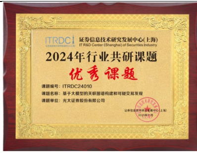
图：上交所行业共研课题优秀课题证书