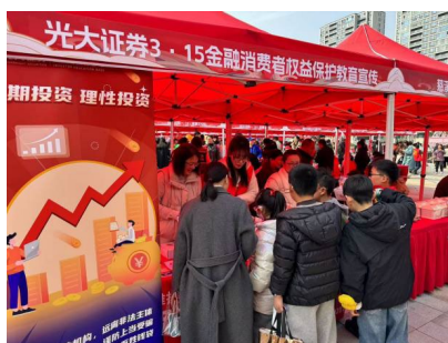
图：“投资者教育进社区”现场图片