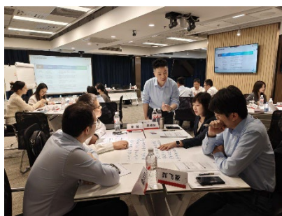
图：新员工导师赋能培训

此外，公司将可持续发展理念融入教育培训工作，面向合规、风控、财富等相关单位人员组织风险管理、职业道德、反洗钱培训，拓展AI工具等赋能课程，开展专题培训158场，覆盖人群40,298人次，提升治理效能，推动ESG原则融入业务决策与工作流程。