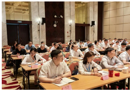
图：深入贯彻中央八项规定精神学习教育专题培训暨基层一把手政治能力提升培训

本年度，公司组织公司高管、中层干部分期参加集团政治能力提升专题培训班、《习近平经济文选》第一卷联学培训班；举办两期深入贯彻中央八项规定精神学习教育专题培训暨基层一把手政治能力提升培训班，引导营业部负责人树立正确的权力观、政绩观与事业观。围绕建强基层战斗堡垒，组织党务干部轮训班、支部书记培训班和深入学习贯彻党的二十届四中全会精神暨加强基层党建工作干部进修班，开展深入贯彻中央八项规定精神学习教育、学习党的二十届四中全会精神和党员网络培训班，提升全体党员政治素养。