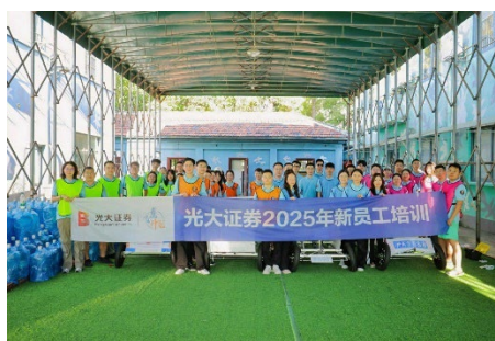
图：“飞鹰计划”新员工培训

光大证券高度重视员工专业能力培养，积极支持员工参与各类培训提升活动，为员工参与各类培训和资格认证提供支持，选派优秀骨干参与行业协会的各类培训活动，对员工参与证券、基金等从业资格考试费用及教材费予以报销，组织从业人员参与行业后续培训和行业专业课程。