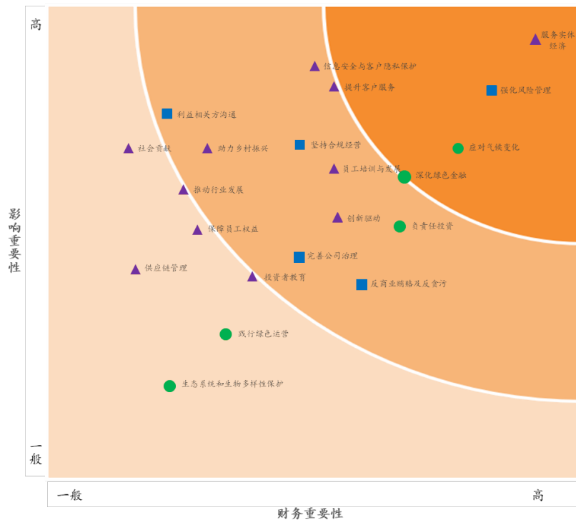
重要性议题矩阵图