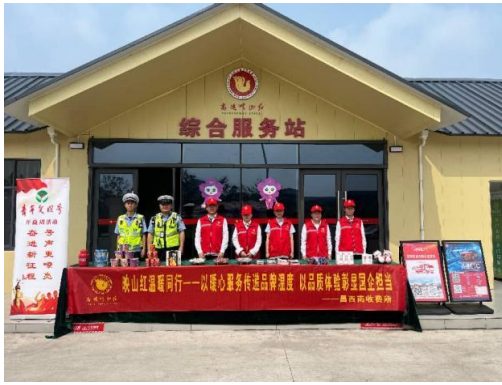
收费站综合服务站