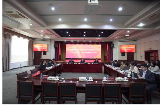
赣粤高速 2025 年第二次临时股东大会