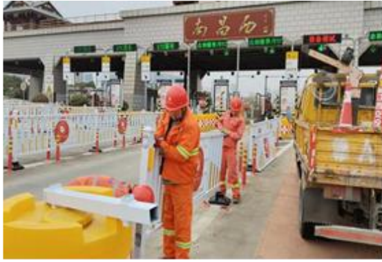
工作人员设备调试维护