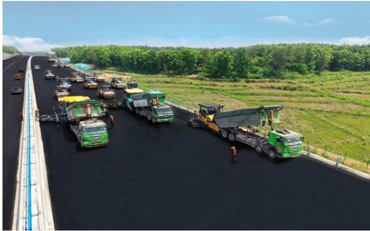
多源固废全结构再生沥青路面

立的一套保证措施新机制，契合我国绿色低碳、节能减排基建新理念，为江西省和全国树立可复制可推广新模式。