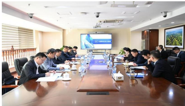
赣粤高速第九届董事会第十二次会议

公司董事会严格依据法律法规及《公司章程》赋予的职权，秉持科学决策、审慎决策原则，高效履行战略决策、经营监督等核心职责。为进一步规范董事会运作，公司修订完善了《董事会议事规则》，提升决策效率与科学性。同时，独立董事坚守独立、客观、公正原则，忠实履行岗位职责，积极行使独立判断权，切实维护中小股东合法权益。董事会下设审计委员会、提名委员会、薪酬与考核委员会及战略与投资决策委员会，为董事会科学决策提供专业支撑。报告期内，公司共召开 8 次董事会，审议议案 63 项；召开专门委员会会议 15 次，审议议案 30 项。