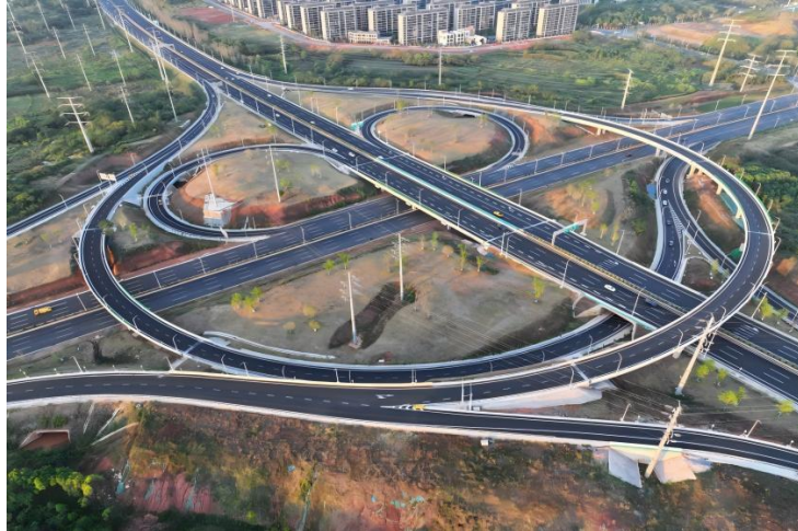
装配式桥梁工业绿色建造