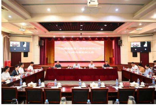
赣粤高速 2024 年年度股东大会