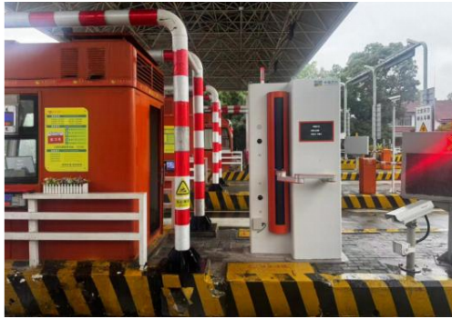
收费站运行机械臂式缴费发卡机