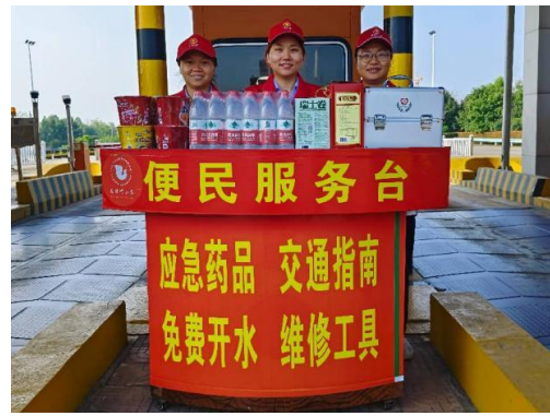
收费站便民服务站