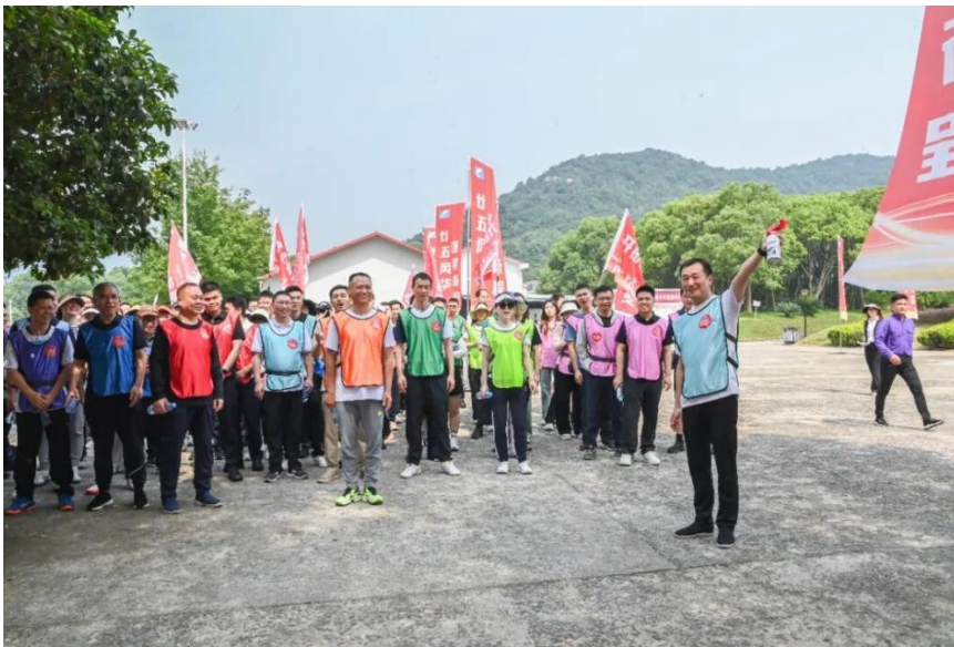
赣粤高速开展趣味团建活动

公司持续丰富职工精神文化生活，组织策划多元化的职工文体活动，营造和谐奋进的文化氛围，组织健身瑜伽、户外健步走、趣味运动会、各类球赛等文体活动，完善职工文体活动设施，引导员工快乐工作、健康生活，有效舒缓工作压力、增强身体素质，持续提升团队向心力与集体归属感。