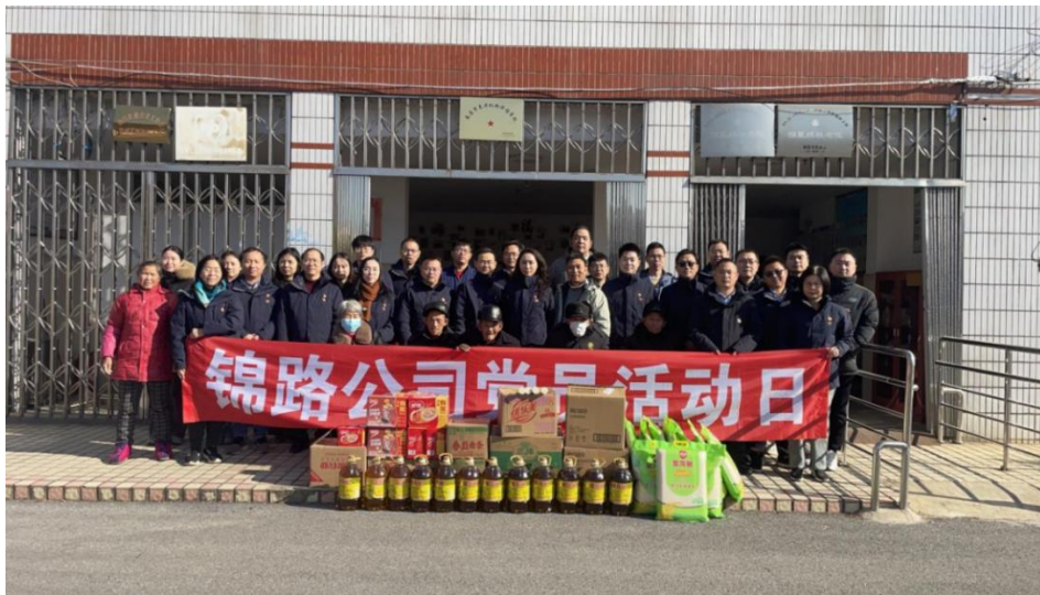
开展敬老院慰问志愿服务活动

公司积极开展志愿服务活动，前往南昌县塔城乡敬老院开展慰问志愿服务活动，捐赠生活用品、米、油等物资；前往万寿宫商圈开展学雷锋志愿服务活动；前往昌北机场开展“春运”暖冬志愿服务行动。