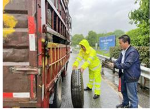
工作人员在现场帮助维修车辆