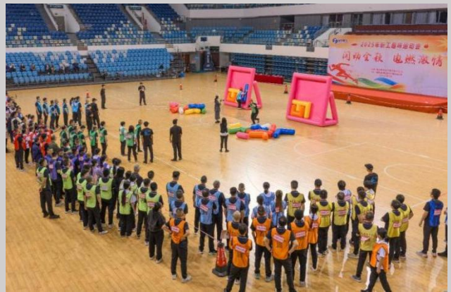
图右：开展职工趣味运动会