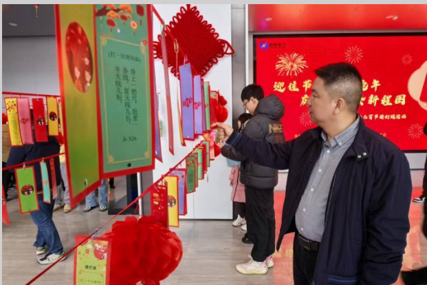
图左：开展元宵节猜灯谜活动

公司始终践行“善能筑业、共生共赢”的企业使命，秉持“以人为本”的管理理念，将关心关爱员工作为重中之重。公司致力于在发展中持续改善员工生产生活条件，稳步提升收入水平，让广大员工共享企业发展成果。通过深入一线和班组，及时了解员工思想动态与实际困难，特别关注女性员工身心健康，对因病因伤、家庭变故等原因致困的员工家庭，根据公司困难员工家庭补助管理办法及员工重疾医疗互助基金，常态化开展困难员工的精准帮扶。持续做好退休员工关怀，扎实开展“夏送清凉、金秋助学、冬送温暖”、带薪疗休养等活动，在逢年过节及员工生日、婚丧、生育、住院等重要节点及时送上关怀慰问。通过开展“我为员工办实事”实践活动，聚焦员工急难愁盼问题；同时，开展员工喜闻乐见的文体活动，不断丰富员工精神文化生活，凝聚干事创业的强大合力，同心协力构建和谐闽电。