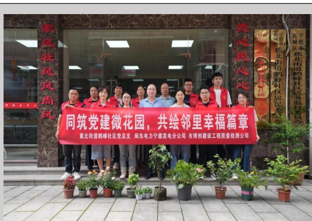
图右：宁德发电分公司联合蕉城区蕉北街道鹤峰社区党总支等单位开展“同筑党建微花园 共绘邻里幸福篇章”公益植绿共建活动