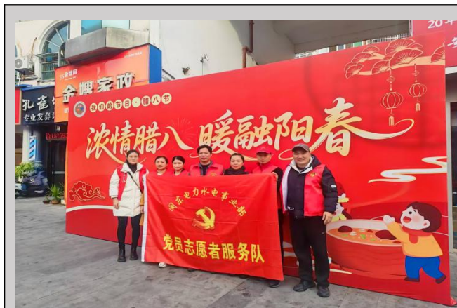
图左：水电事业部党员志愿者服务队走进阳春社区，开展“浓情腊八 暖融阳春”主题党日活动

实现了“1+1 大于 2”的共建效能。通过将服务群众、助力发展的理念融入活动全过程，在参与基层治理、支持地方建设、解决民生需求等方面持续发力，切实把党建共建成果转化为推动地方经济社会高质量发展、增进民生福祉的实际成效，生动展现了公司共融共进、服务大局的国企形象。