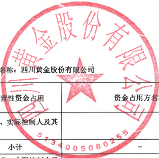
2025年度非经营性资金占用及其他关联资金往来情况汇总表