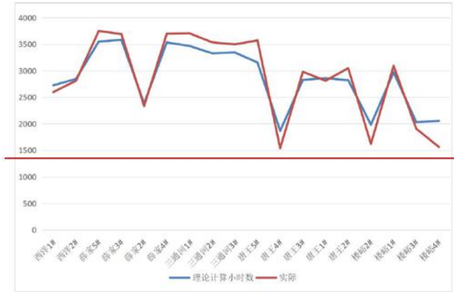
二 理论计算小时数与实际运行小时数对比图