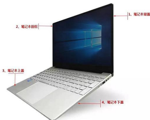
图：笔记本外壳示意图

公司为主流消费电子产品厂商提供精密结构件模组产品，其中以笔记本电脑结构件模组为主。笔记本电脑结构件模组包括四大件：背盖、前框、上盖、下盖以及金属支架，上述结构件模组在装配笔记本电脑过程中需容纳显示面板、各类电子元器件、转轴等部件，其结构性能对制造精密程度提出了较高的要求。同时由于其还具有外观装饰功能，故该类产品对生产企业的设计能力亦有较高的要求。