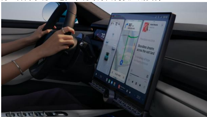
图：新能源汽车镁合金中控屏示意图

公司在镁合金材料应用方面具有多年的制造经验和技術优势，通过半固态射出成型技术，在新能源汽车的轻量化发展趋势中，通过车载屏幕快速切入到新能源汽车的零部件供应链中，可为新能源汽车中控系统、转向系统、电控系统等方面提供应用支持。