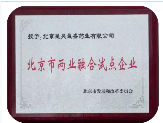
北京星昊盈盛药业有限公司获评北京市两业融合试点企业