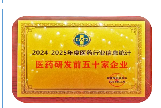
星昊医药被全联医药业商会评为 2024-2025 年度医药行业信息统计医药研发前五十家企业

广东星昊药业有限公司的多西他赛注射液获得美国 FDA 批准； 星昊医药氯雷他定片通过一致性评价，取得补充申请批准通知书； 星昊医药及子公司有 9 个品种取得药品注册证书。