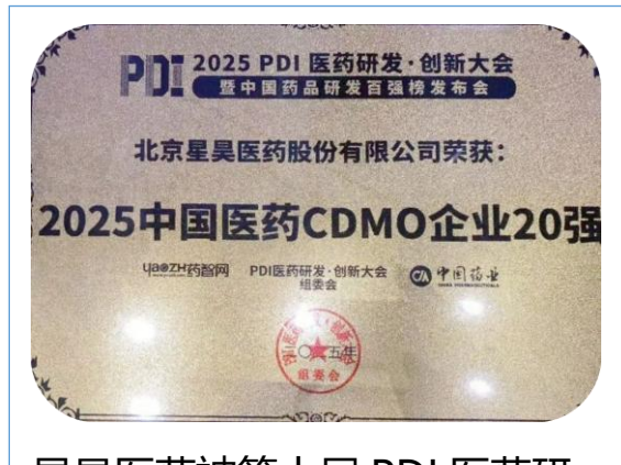
星昊医药被第十届 PDI 医药研发创新大会评为 2025 中国医药 CDMO 企业 20 强