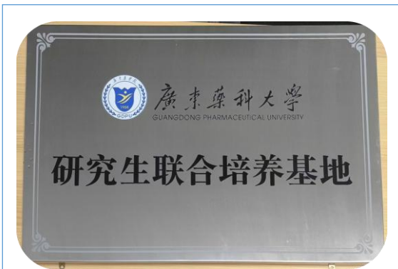
广东星昊药业有限公司成为广东药科大学研究生联合培养基地