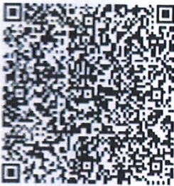
上标为年检二维码

本证书经检验合格，继续有效一年。 This certificate is valid for another year after this renewal.