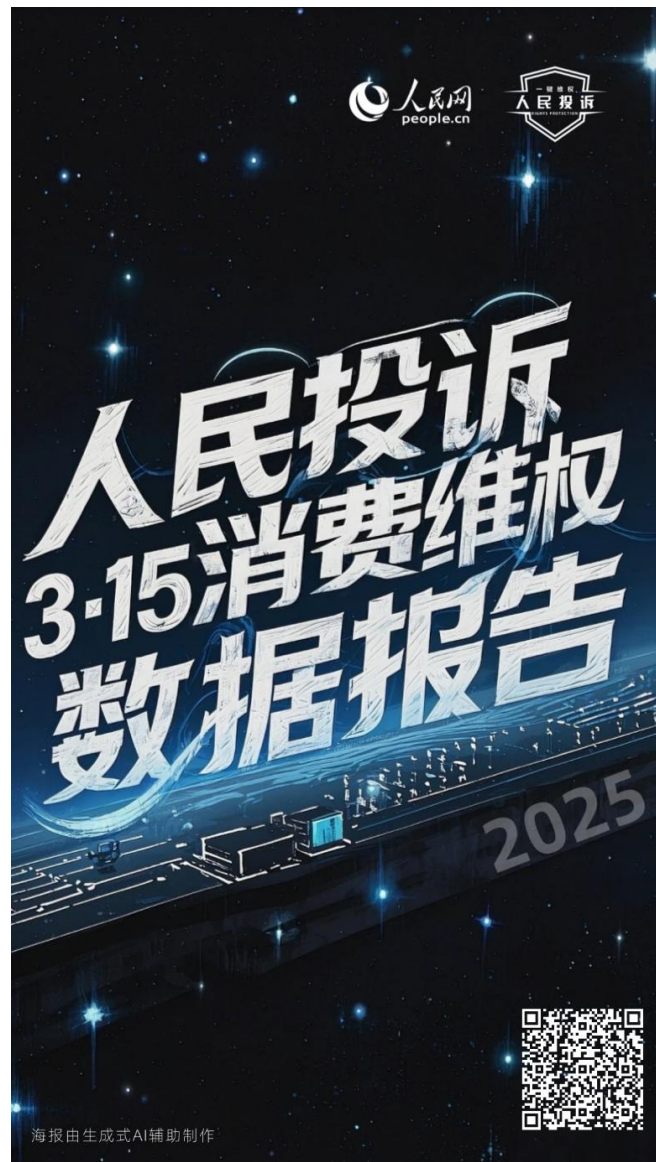
“人民投诉”平台发布2025年“3·15”消费维权数据报告

力“一键维权”。2025年，平台实现跨越式发展，全域消费服务新生态初具规模——平台功能与生态持续拓展。平台深化与《人民日报》等权威渠道的联动，全年推动15篇监督报道落地。平台创新打造的系列数据报告与“诉说消费”融媒专栏，以“短视频+深度解析”等多元形态，在揭示行业风险、指导理性消费、震慑违规行为方面发挥了重要作用，有力推动消费维权领域网络生态的“流量向善”。