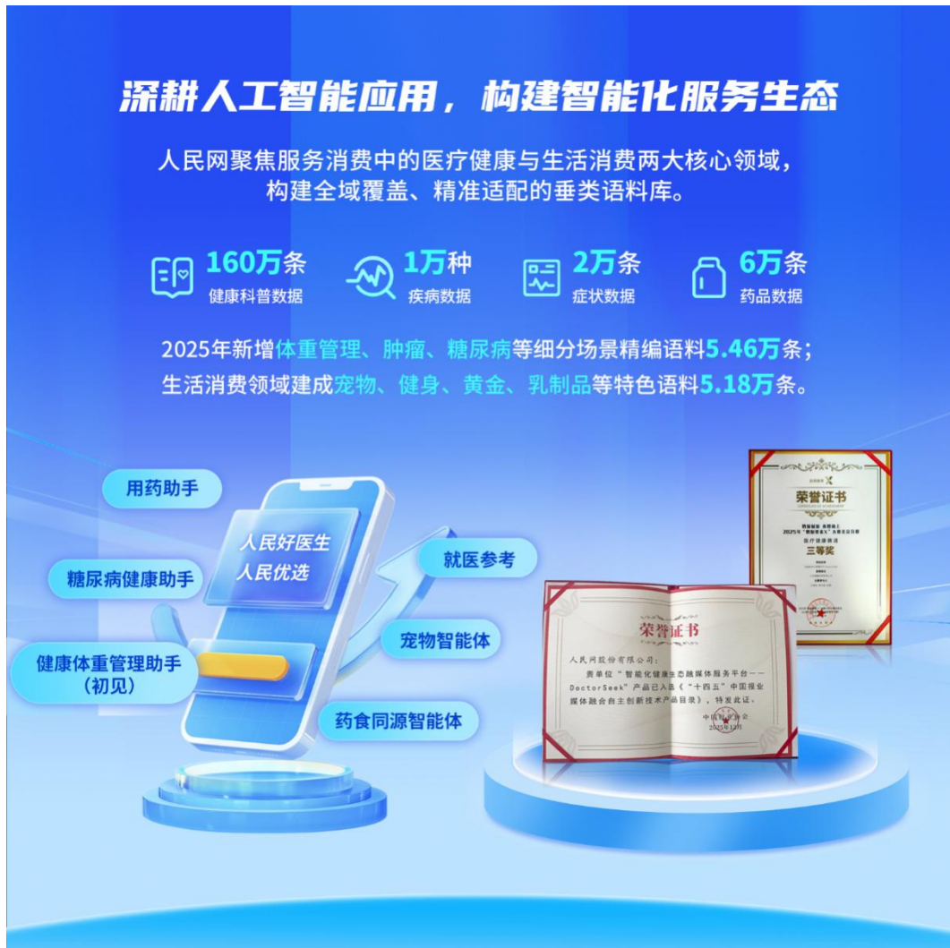
人民网构建垂类语料库，探索智能化应用

等细分场景精编语料 5.46 万条；生活消费领域建成宠物、健身、黄金、乳制品等特色语料 5.18 万条。语料库依托“人民好医生”“人民优选”平台，上线糖尿病健康助手、健康体重管理助手（初见）、用药助手、就医参考等产品，开发宠物智能体、药食同源智能体。人民好医生 AI 智能导诊健康助手获 2025 年“数据要素×”大赛北京分赛三等奖；人民好医生 DoctorSeek 入选“十四五”中国报业媒体融合自主创新技术产品目录。