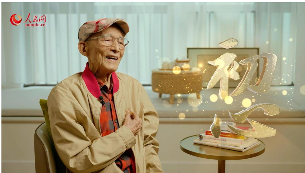
“初心”栏目专访游本昌节目截图

人民网“初心”栏目结合多个重要节点，以“追梦”为主题主线，专访不同领域多位具有影响力、代表性的名人，进一步提升栏目影响力。2025 年 6 月 30 日，“初心”栏目全网独家首发 92 岁表演艺术家游本昌高龄入党的专访，迅速引发各家媒体及网友“刷屏式”转发热潮，形成现象级“破圈”效应。该专访在人民网各平台总阅读量超 1.6 亿，相关话题同时登上微博、抖音、快手三大平台热搜榜首位。