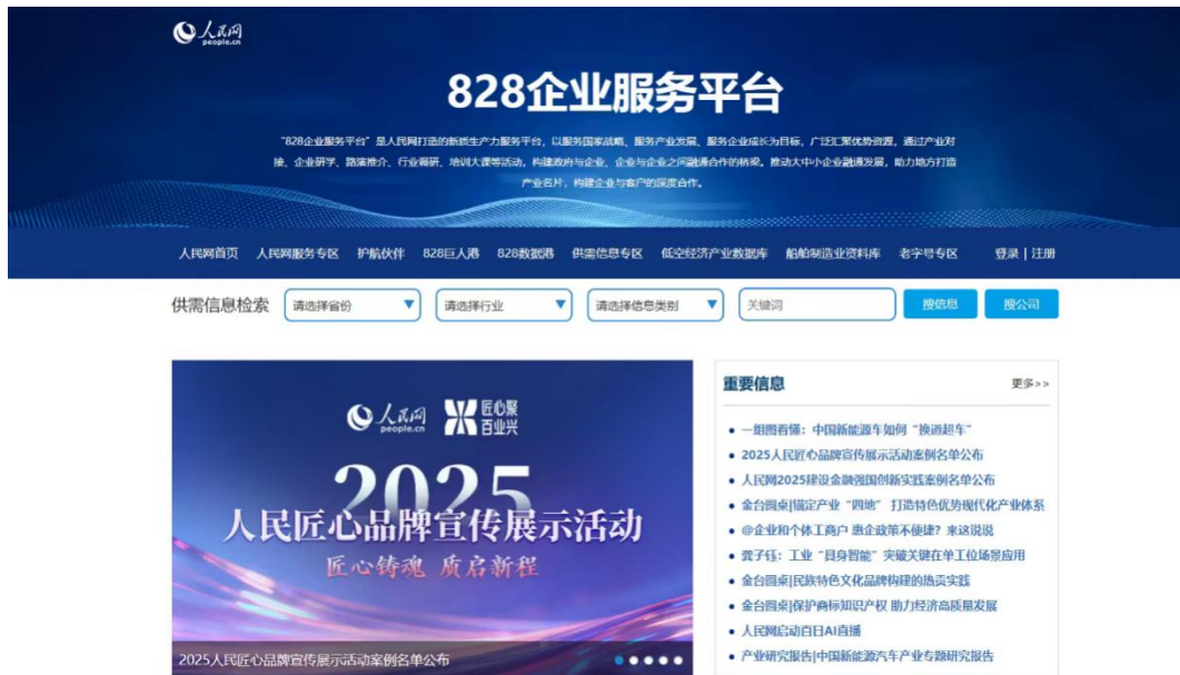
“828 企业服务平台”官网

数据港”“京津冀人才港”等产业服务平台，同时上线低空经济产业数据库，启动“雄安 AI 科技大厦”，在产业服务方面迈出坚实步伐。“828 巨人港”持续开展产业对接会、路演沙龙、政策宣讲会、企业研学等活动，推出“走进北交所”“小巨人加速营”“巨人港观察·伙伴故事”等特色服务，丰富资源对接通道，巩固和提升政府、产业与企业服务能力。