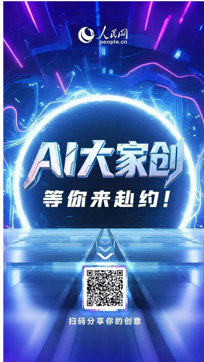
“AI 大家创”全民挑战赛活动海报