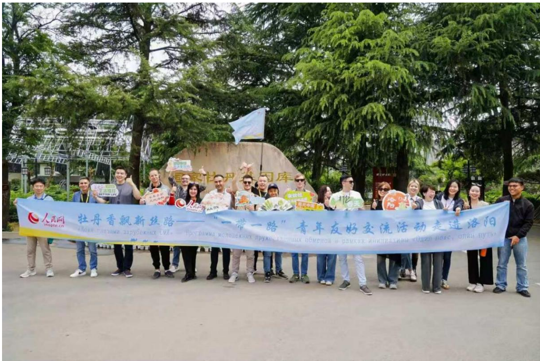
“一带一路”青年友好交流活动促进中外民心相通

着力打造品牌栏目赋能外宣工作。“城·事”“酷玩推荐官”等外宣栏目对外推介好地方故事；拉紧“一带一路”人文交流纽带，成功举办“一带一路”青年友好交流活动，努力促进中外民心相通；“高质量发展故事汇”栏目坚持内外宣协同推进，每期同步推出英文报道，覆盖人民网英文频道、环球时报英文版以及海外社交媒体平台。