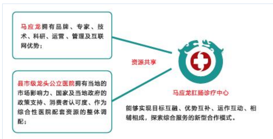
图：马应龙肛肠诊疗中心合作模式

医疗服务为公司聚焦肛肠优势领域，实施由药向医延伸、拓展服务边界的重要举措。公司拥有肛肠专科连锁医院，汇聚了一批由中国肛肠病治疗领域最具影响力的专家领衔组成的医生团队。同时，强化轻资产运营，先后与百余家县市级公立医疗机构共建马应龙肛肠诊疗中心，依托公司在肛肠领域的既有优势，在肛肠专科标准化建设、肛肠诊疗技术系统培训及规范、疑难病远程会诊等方面为合作医疗机构提供全方位服务。公司持续深挖诊疗中心网络价值，着力促进医药互动经营。