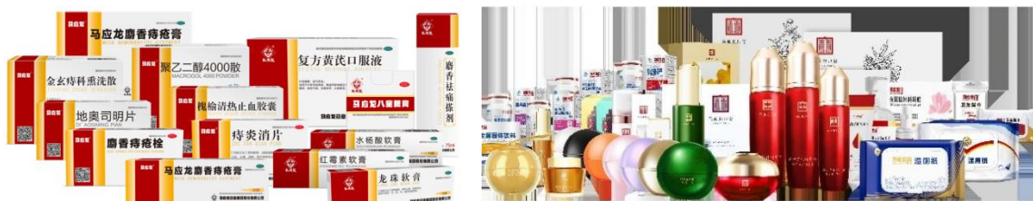
图：马应龙主要药品、大健康产品

眼霜、眼部精华、眼部精油等为代表的眼部健康产品，以及持续开发“内调外养”系列产品的皮肤类健康产品。