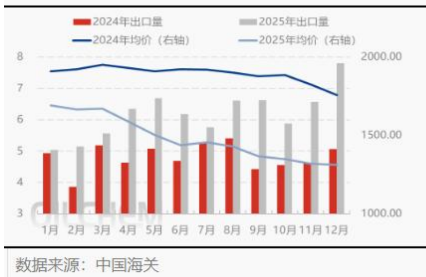
图2 2024-2025年PA6出口量变化图 (万吨、美元/吨)

在内部需求偏弱、价格持续承压的背景下，出口成为2025年尼龙6行业的重要支撑。国内PA6切片价格走低后出口竞争力增强，叠加海外汽车等下游领域需求持续增长，共同推动切片出口量显著攀升。据隆众资讯数据，2025年国内PA6出口市场呈现强劲增长态势，全年累计出口量达74万吨，较2024年同比增长28%，行业出口规模实现大幅突破。