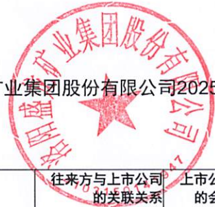
洛阳盛龙矿业集团股份有限公司2025年度非经营性资金占用及其他关联资金往来情况汇总表（续）