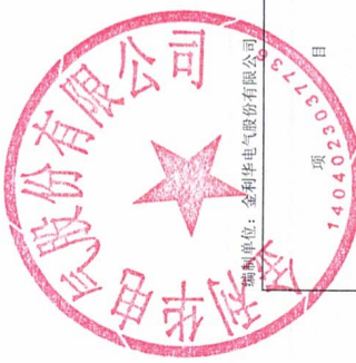
母公司股东权益变动表 2025年度