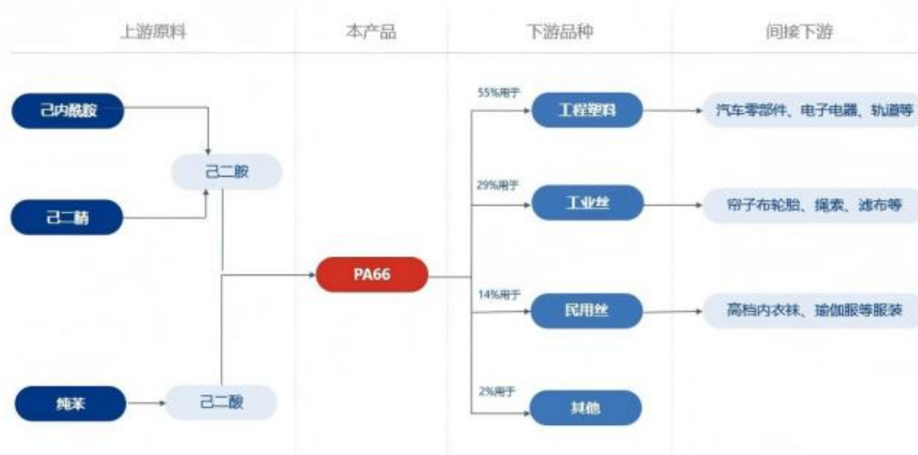
PA66 产业链上下游结构图