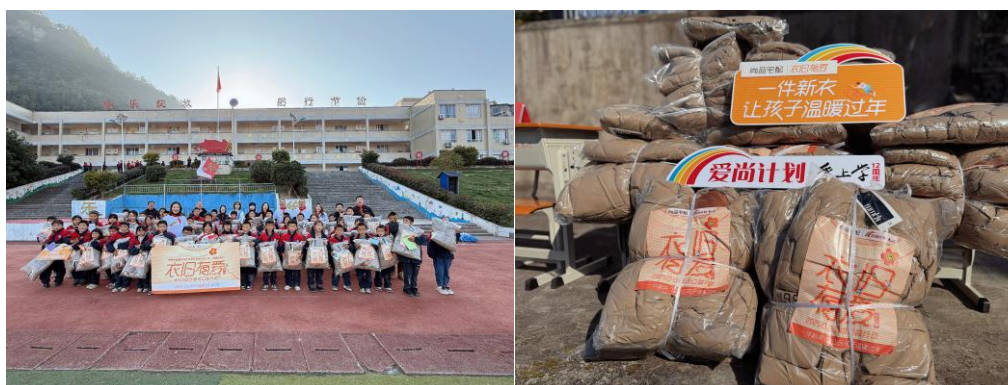
图8：“衣旧有爱”部分活动花絮

2025年11月28日，“衣旧有爱”携手贵州遵义桐梓、广东四会大旺经销商志愿者，将110件新冬衣送往遵义市正安县乐俭镇金叶小学、辽远小学和中心小学。