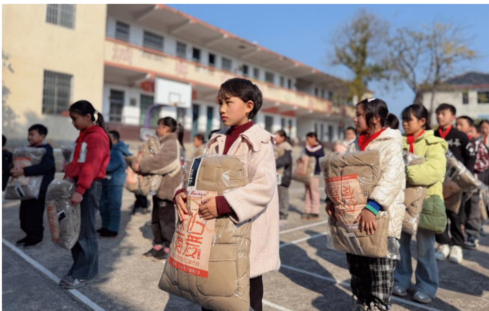
图9：“衣旧有爱”走进长流小学