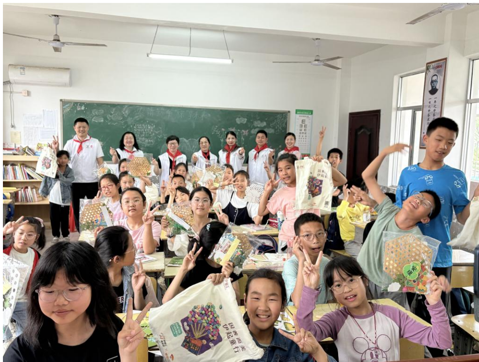
图6：“心意行动”走进三郎小学

2025年5月15日，“心意行动”联合维意定制岳阳店、长沙店、汨罗店志愿者，走进岳阳市三郎小学和团洲小学，捐赠17台书吧、900册图书、帆布包700个、价值1500元的体育用品及文具用品若干。