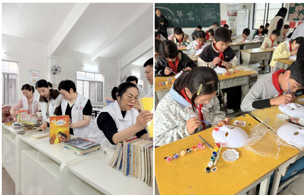
图7：“心意行动”部分活动花絮

自2014年发起至2025年12月31日，“心意行动”累计捐赠图书15.98万本、书吧1577台，覆盖319所学校，惠及41365名学生，持续吸引各界志愿者广泛参与。