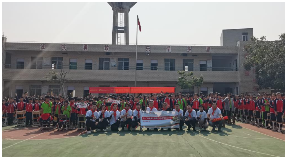
图2：“爱尚计划”12周年首站

2025年3月20日，“爱尚计划”十二周年行动正式启动，首站携手广东市场团队及佛山、湛江、廉江三地经销商志愿者，走进湛江廉江市良垌镇第二小学，为孩子们送去150套课桌椅及一批新图书。