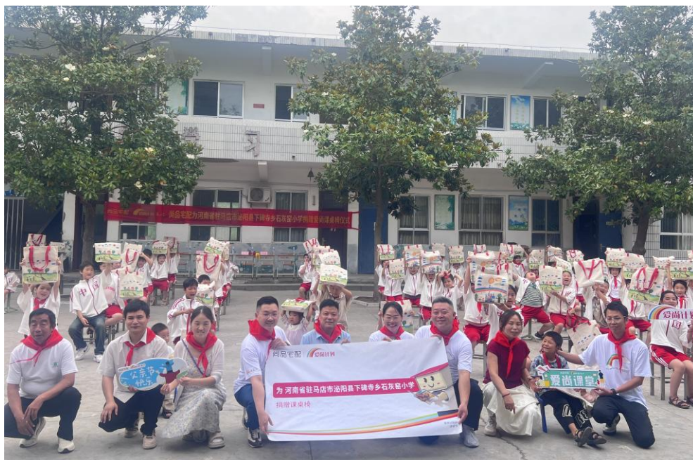
图3：“爱尚计划”走进下碑寺乡石灰窑小学

2025年9月8日，“爱尚计划”携手云贵市场团队及云南蒙自、建水、马关、文山四地经销商志愿者，为云南省文山州马关县八寨镇老厂小学送去80套课桌椅、70个书包、100个定制徽章，并为学校教师送去8个定制水杯。