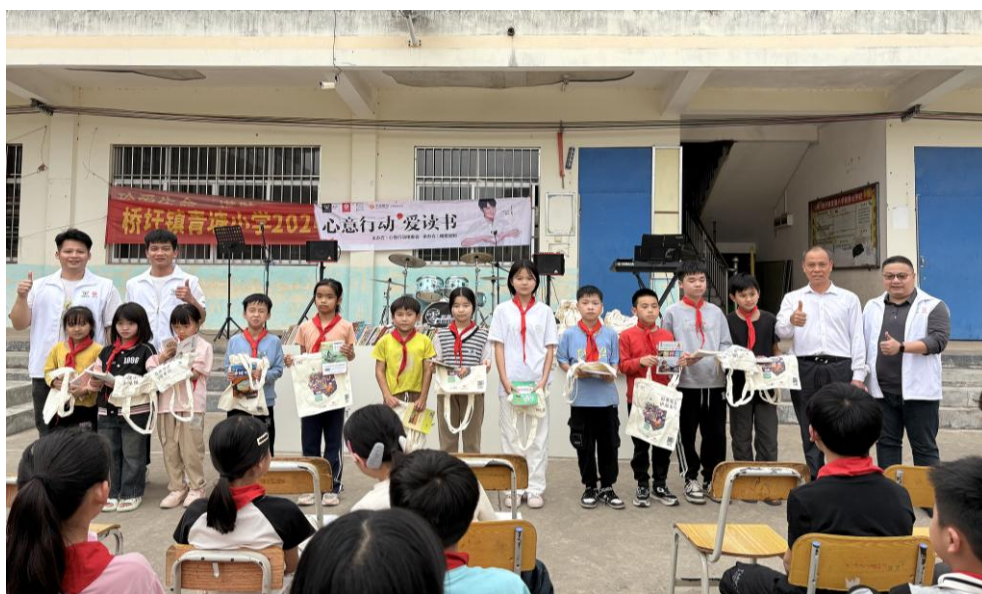
图5：“心意行动”走进青塘小学

2025年3月14日，“心意行动”联合维意定制贵港店志愿者，走进贵港市永梧小学和青塘小学，捐赠17台书吧、570册图书及600个帆布包。