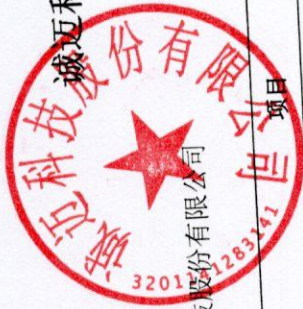
诚迈科技股份有限公司 2025 年度营业收入扣除情况表