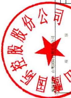
合并股东权益变动表（续） 2024年1-12月