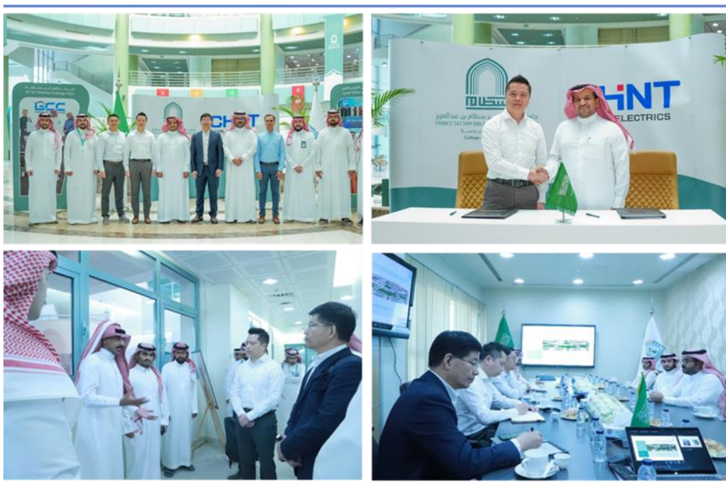
图 2：正泰国际与 PSAU 签署备忘录

抓住电网升级改造、数字基础建设、绿色经济以及高附加值工业发展等机会，纵深推进“全球区域本土化”战略，巩固欧洲核心市场，全力拓展亚太、西亚非区域市场，培育发展北美、拉美等区域市场。