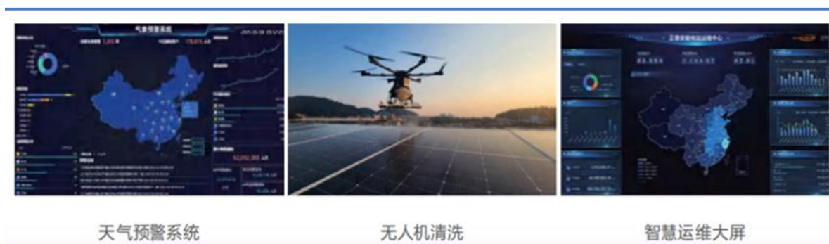
图 5：正泰安能智慧运维方案

正泰安能以数智技术为核心驱动力，系统性推动运维体系与质量管理向智能化、精细化转型，全面提升电站资产全生命周期的管理效能，获取运维带来的发电提升超额收益。依托智慧运维大数据云平台，研发海量电站发电数据高效采集与分析系统，构建损失电量核算模型、电站健康度评估、组件脏污检测等多维度智能诊断模型，搭配无人机红外巡检、自动机器人清洗等线下智能化运维手段，依托千站级服务集群，打造分布式光伏智慧运维新模式。截至目前，正泰安能户用电站运维规模近 60GW。