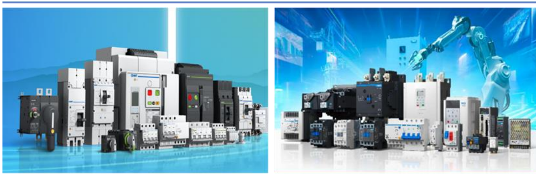
图 3：正泰电器产品系列图

聚焦新型电力系统、新能源风光储充、数据中心、轨道交通等关键应用场景，以数智融合驱动技术创新，攻坚智能配电与电力电子等核心技术，打造面向未来的新一代创新产品。