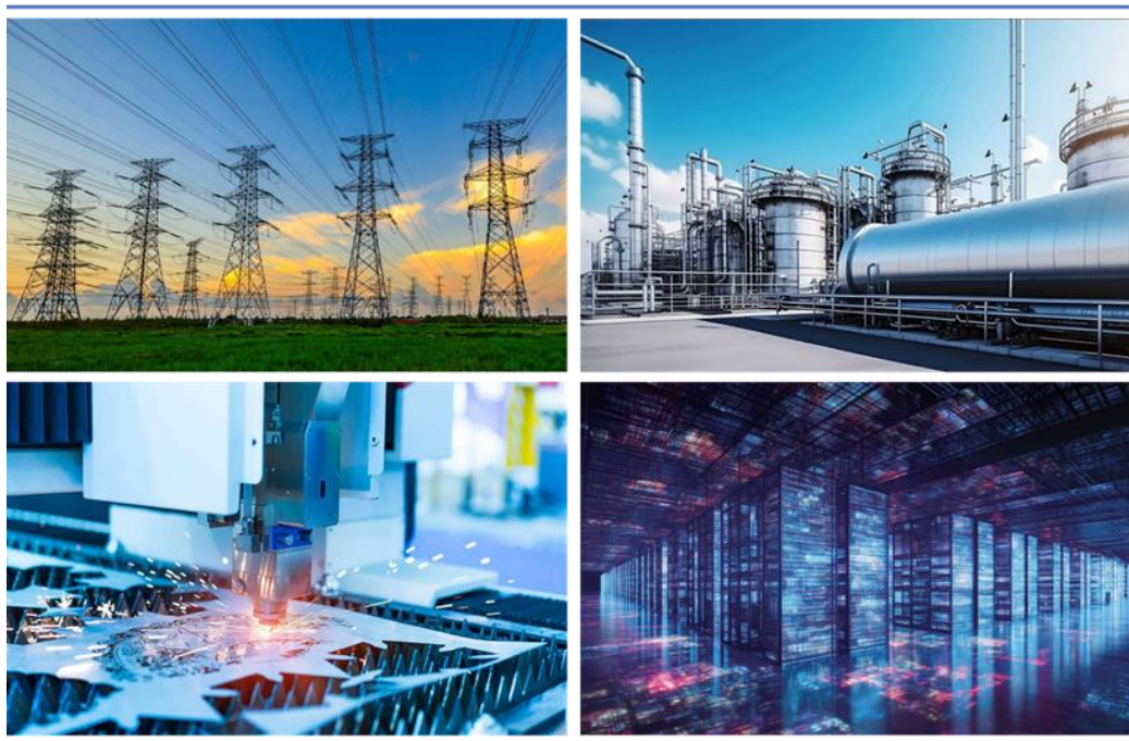
图 1：正泰电器各行业解决方案