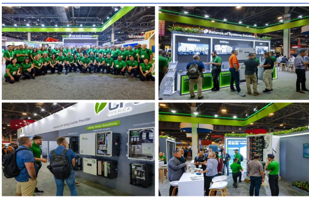
图 7：正泰电源参加美国国际太阳能展

欧洲光储业务再谱新篇。在欧洲光储业务，系统推进欧洲市场品牌建设和渠道拓展，逐步实现全欧市场战略覆盖。波兰、土耳其、西班牙、葡萄牙、罗马尼亚、保加利亚、意大利、乌克兰等多个重点市场实现光储项目落地，为后续大规模市场拓展奠定了坚实基础。这一系列成果标志着欧洲市场全球业务版图更趋完善。在欧洲持续推进西班牙 Blueprom10MWh、摩尔多瓦 26MW/50MWh、德国 POR4.8MW/10MWh、乌克兰 15MW/60MWh、罗马尼亚 GRT7.2MW/30MWh、丹麦 10MW/20MWh 等多个关键储能项目，为客户优化区域能源供需结构、增强能源网络韧性、提升区域电力系统稳定提供了坚实保障。