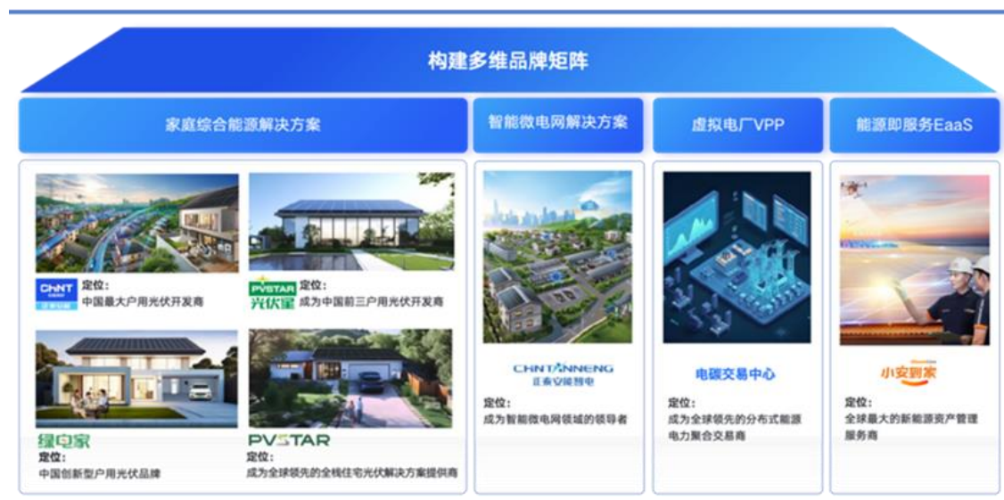
图 4: 正泰安能品牌矩阵

报告期内,公司面向多元创新用能场景,推出“自发自用、余电上网”模式的“泰益宝”产品,切实为用户降低用电成本。发布“泰墅”系列家庭绿电解决方案,深度融合家庭绿电与智能家居科技,助力用户实现能源自主和用电自由。推出“即发即用、就近消纳”的阳台光伏产品,凭借灵活便捷、低门槛的优势,成为大众管控电费支出的务实优选。