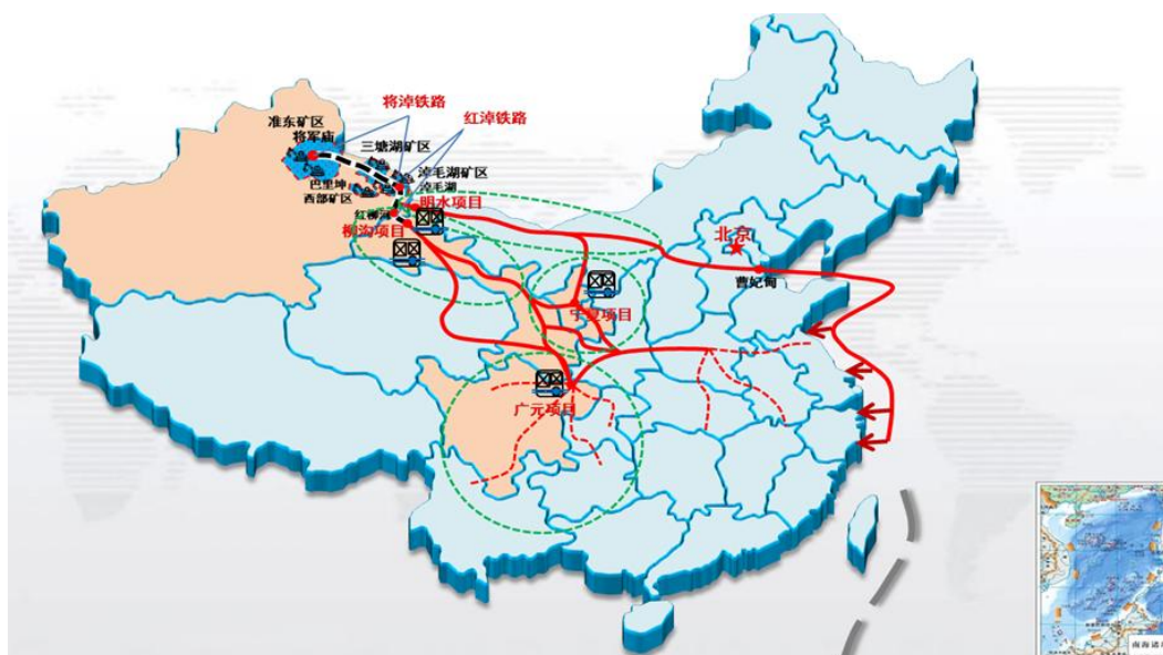
(1) 柳沟综合能源物流基地

公司在下游积极利用综合能源物流基地实现业务延伸。一是通过在资源紧缺地区布局综合能源物流基地，从而将新疆优势能源产品尤其是煤炭产品进行库存前移，将其作为煤炭产品销售的前置仓；二是通过淡储旺用进行煤炭战略储备，调节季节差异带来的市场需求；三是通过“点对点”运输，提高铁路运输效率，提升“疆煤外运”运量，增强疆煤在终端市场的竞争力；四是将运营的综合能源物流基地编织成网，充分发挥基地的节点辐射效应，相互之间形成物流支撑，提高能源物流的响应效率，扩大终端市场份额，夯实主业发展基础，增厚能源物流主业收益。