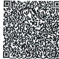
彭震根的年度二维码