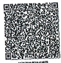
标识的年检二维码